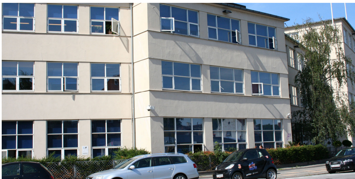
dk4's hovedkontor på Rådmandsgade i København.