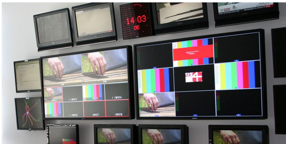
dk4's "continuity" hvorfra kanalen styres 24 timer i døgnet, 365 dage om året.

dk4 sender fra Danmark og er underlagt den danske reklamelovgivning. Det er annoncørens ansvar, at reklamerne overholder reklamereglerne og ikke strider mod tredjemands rettigheder.